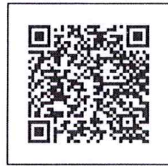
คู่มือการประกวดฯ